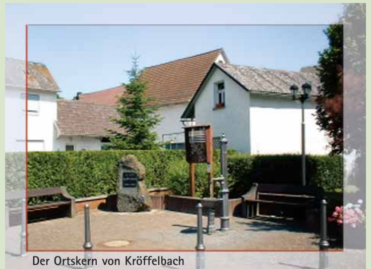
Der Ortskern von Kröffelbach