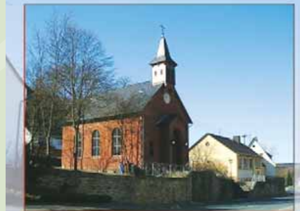
Die Ortsmitte von Weiperfelden