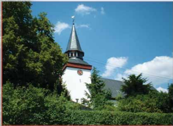
Evangelische Kirche in Griedelbach