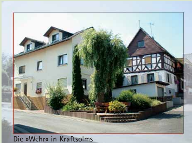
Die »Wehr« in Kraftsolms